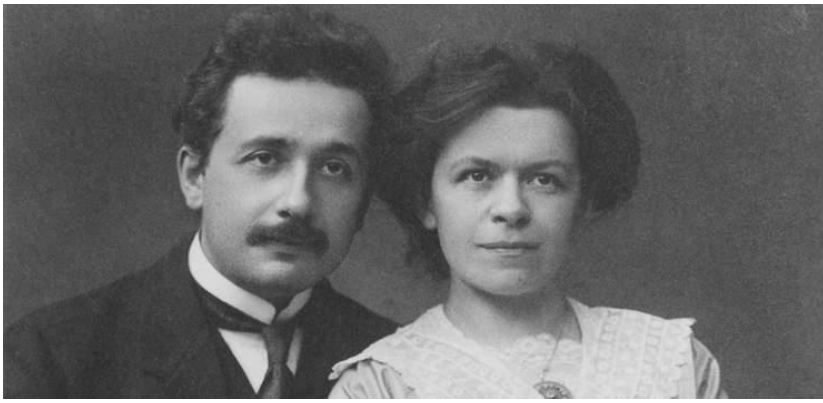
Bild: Albert Einstein mit seiner ersten Ehefrau, Milena Marić, 1912.

Jedenfalls: Habt ihr gewusst, dass Einstein etwas sehr Spannendes über die Zeit herausgefunden hat? Er hat herausgefunden, dass die Zeit an einem Ort viel langsamer vergeht, wenn sich dieser Ort extrem schnell bewegt. (Das tönt jetzt etwas paradox, und scheint auch unserer Erfahrung zu widersprechen – aber nur deshalb, weil wir uns selber nie mit so hoher Geschwindigkeit bewegen.)